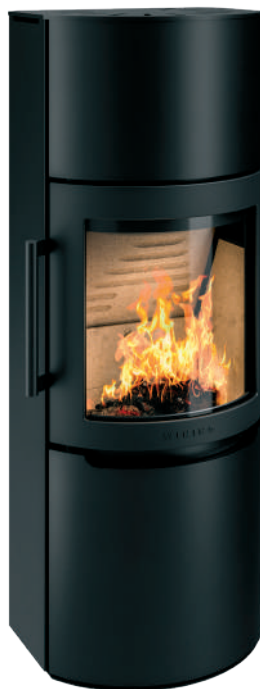
WIKING Mala 6