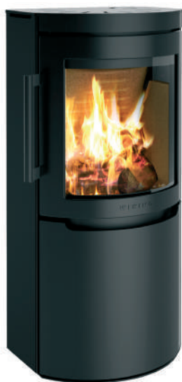
WIKING Mala 4